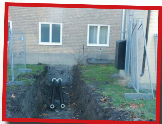
Nya fjärrvärmeledningens ingång till Sundbyskolan. (Huset närmast till höger i bild hör till skolans fliseldade värmepanna, som snart tas ur bruk)