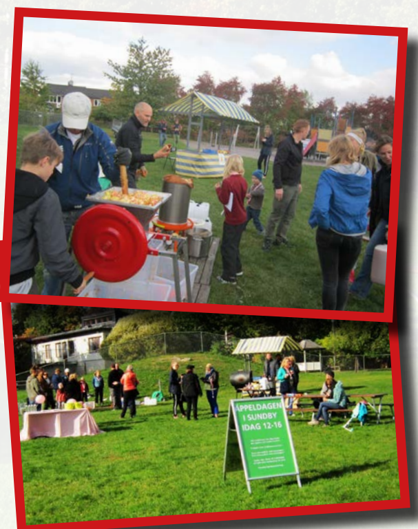
Ca 60-70 medlemmar deltog under dagen.

Som vanligt gästade en pomolog, som på begäran artbestämde äpplen. Dessutom bjöds det på grillad korv från Dennis kött i Spånga, tack vare generös sponsring från Skandiamäklarna.