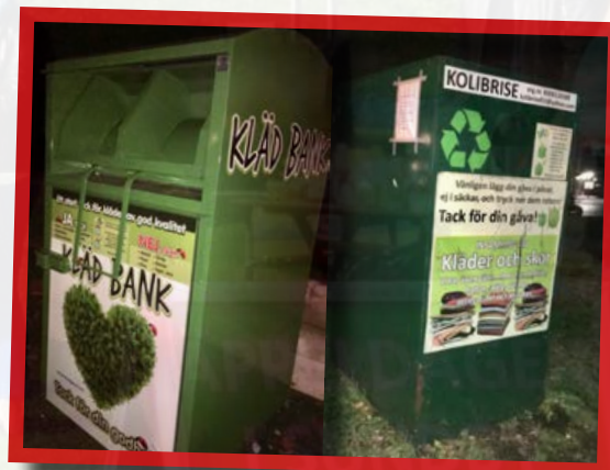
Yterst tveksamma containrar.