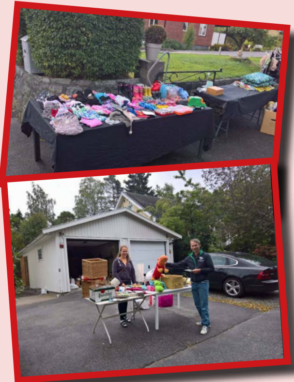
Några av årets försäljningsställen.

Inför nästa år ska vi se över datumet för att inte ha krock med Solvalla, Spångadagen och även Cykelfesten – även om det var väldigt praktiskt att på söndag kunna åka ner till Solvalla med resten av grejerna och sälja tomt på bordet. Vi vill tacka alla som deltog både som säljare och köpare!