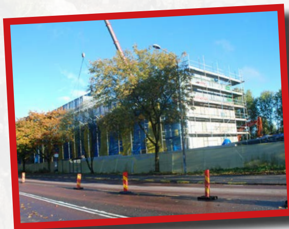
Pågående bygge av studentbostäder, direkt norr om Bromstenvägen.

Aktuellt besked från Stockholms stad är att cykelbanebygget smygstartar någon gång före årsskiftet, för att komma upp ”i full produktionstakt” första kvartalet 2018. Till nästa höst är meningen att gång- och cykelvägen ska vara klar. Vi får väl se.