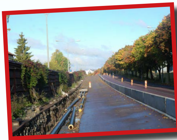
Bromstenvägens södra sida grävts upp, för fjärrvärmeledning.

Fjärrvärmeledningen har på sin väg till Sundby även fått avstickare till några villor. Somliga passade visst på att se om sitt hus.