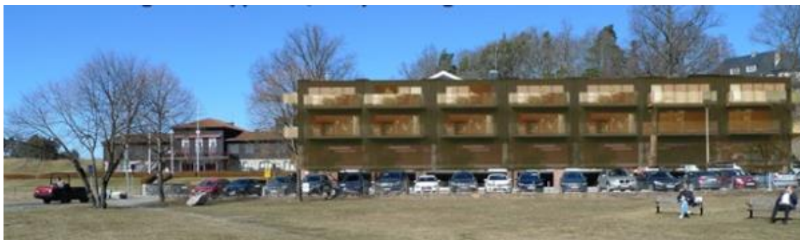
Beslutad detaljplaneändring Kevinge Strand. Stort hus som är främmande i kulturmiljön