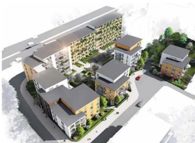
Detaljplaneförslag Gropen (Mellan Mörby C och Danderyds kyrka). Går planen igenom, så har vi 49% lägenheter i flerfamiljshus i "Villastaden" Danderyd