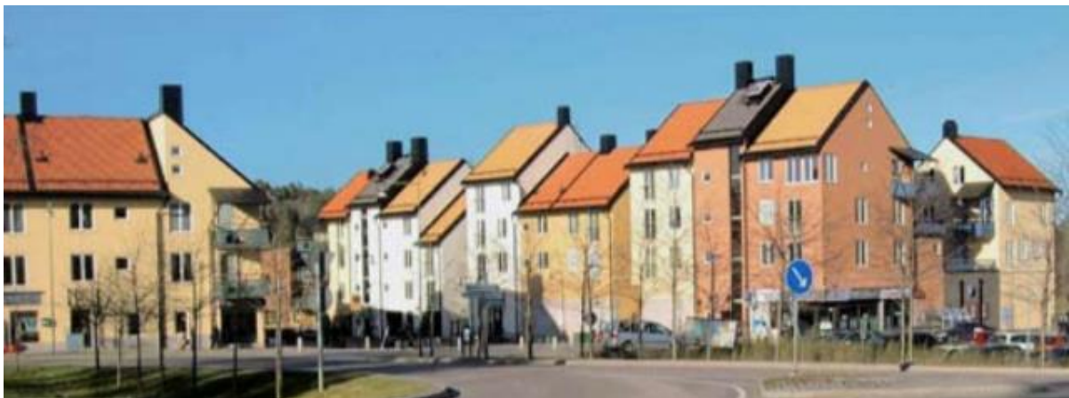
Centrum Tyresö Strand (bild från Översiktsplan för Tyresö Kommun)

Villaägarna vill att områdets karaktär bevaras och förstärks vid utvecklingen, så att området fortsätter att vara attraktivt även för de villaägare som bor i området idag. Goda exempel på detta tycker vi är Ekerö Centrum och centrum för Tyresö Strand där man tagit tillvara på närheten till vatten och byggt låga centrum som passar in i befintlig miljö.