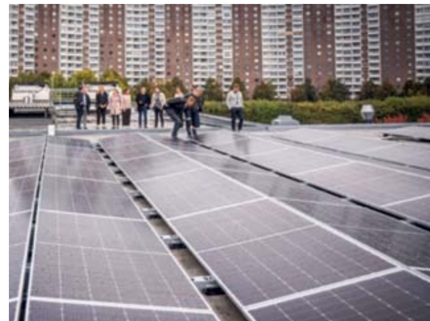
Unibail-Rodamco-Westfield har invigt sin solcellsanläggning på shoppingcentret i Täby.