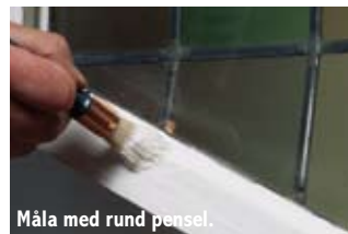
Måla med rund pensel.