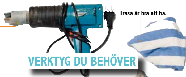
Trasa är bra att ha.