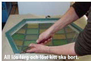
All lös färg och löst kitt ska bort.