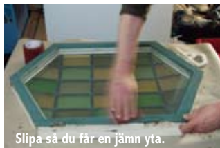
Slipa så du får en jämn yta.